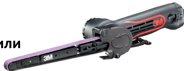
3M™ 33575 Пневматический шлифовальный напильник для лент 13 мм x 457 мм