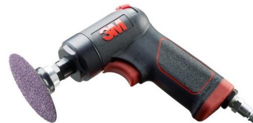
3M™ 33577 Пневматическая угловая зачистная машинка для кругов 50 мм и 75 мм

ПОЛУЧИ ПОДАРОК 3M™ Пневматическая угловая машинка