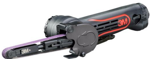
3M™ 33573 Пневматический шлифовальный напильник для лент 10 мм x 330 мм

ПОЛУЧИ ПОДАРОК 3M™ Пневматический шлифовальный напильник для лент